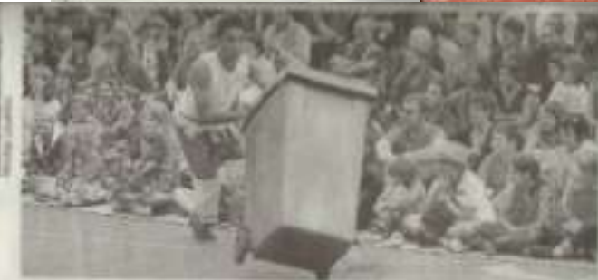
Les quatre comédiens danseurs et chanteurs de la Compagnie Française de 12 ne sont pas des balayeurs comme les autres. Avec eux, bouillottes, pinces et balais se transforment en partenaires de danse pour des chorégraphies langoureuses et ludiques.

12 - 0,85 € - N° 20618 - 100 ansée - Votre journal à domicile : 02-43 83 72-77. Site Internet : www.lemaine-libre.com