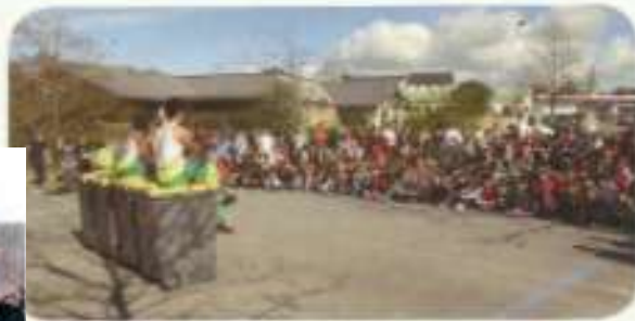
Goûter et spectacle proposés en 2014