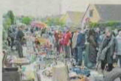
Petites ou grandes affaires, il faut négocier.