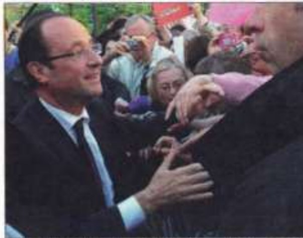
Le chef de l'État est attendu vers 17 h 30 à Périgueux.

Marie BERTHOUMIEU mbertthoumieu@lapresse.com