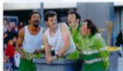
Arts de la rue avec « 12 » par la compagnie Fracasse de 12

À l'initiative de cette année des Nocturnes, des arts de la rue, à 21 h 30, place du Martray, avec 12 par la compagnie Fracasse de 12 pour un spectacle burlesque, chorégraphié, rythmé et poétique.