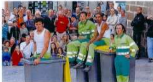
La burlesque déjanté de Fracasse de 12 a séduit le public.

Vendredi soir, la place du Martray et les halles Georges-Dressens ont accueilli deux groupes décapants, à la burlesque bien affichée. Il s'agissait de la Cie Fracasse de 12, spécialisée dans les arts de la rue et du groupe de rock Les yeux d'la tête. Les 500 spectateurs ont été conquis par tant de bonne humeur, de légèreté rythmée et de communion avec le public.