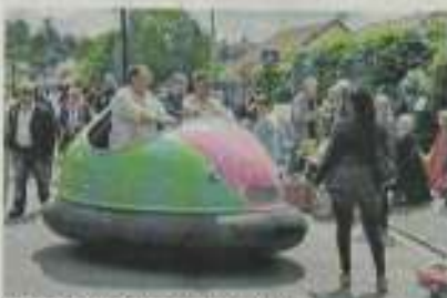
Le Facebook, la drogue des temps modernes

À Tourville-la-Rivière, le 1 er jour de la fête commença dès vendredi avec l'installation de la compagnie Fracasse de 12. Le public a pu apprécier le spectacle, où l'on saute, danse, chante, dans une sympathique et respectueuse ambiance, du bœuf des sports et un bon accompagnement d'un bon de poésie.