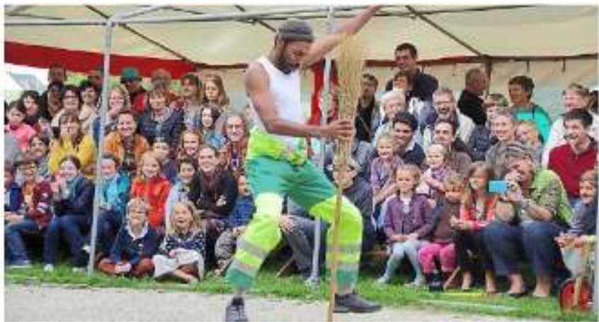
Environ 350 personnes ont assisté au spectacle « Hop ».

Globalement, les visiteurs ont été bien sensibilisés, et de manière festive, à la réduction des déchets : compostage, broyage de déchets verts, éco-achats, réemploi, réparation, achat en vrac, jardinage au naturel, gaspillage alimentaire à travers un certain nombre de stands et d'inv-