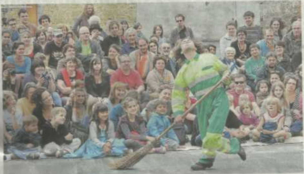
La Flèche, hier après-midi. Place Fagan-Courcier, le quartier éphémère de France de 12 il y avait le pied dans ses habitants - malin.

Même les averses du samedi n'ont pas eu raison de la réussite du festival. Le public était bien là.