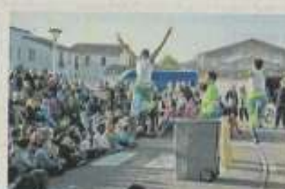
La Compagnie Fracasse de 12 a donné le rythme des Noes