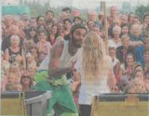
Chaque soir d'été de « Hop », le spectacle d'acrobates met en scène, en référence à la théâtralité traditionnelle, des arts de Renc'Arts sous les étoiles.

Mardi soir, c'était acrobatie, musique, chorégraphie et poésie au menu de la soirée d'été du mercredi à Dinar.