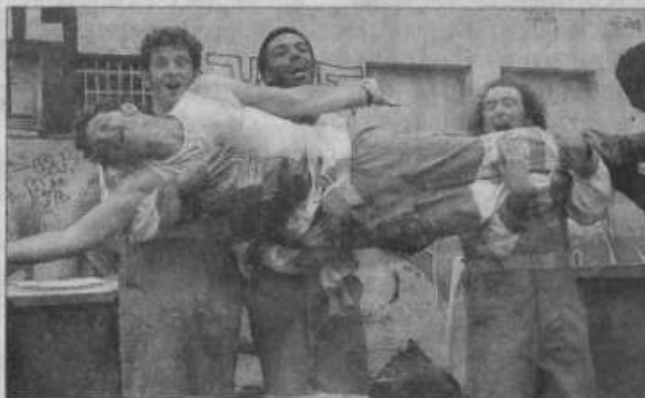
Coup de balais sur les idées reçues.

Hop ! C'est une chorégraphie décapante servie par quatre employés municipaux munis de 4 poubelles et 4 balais. Le chef délirant fait preuve d'une autorité limitée et laisse ses gars exprimer leurs talents cachés. Ils transforment leurs instruments de travail en instruments de musique et en armes de séduction. Ils manient leurs poubelles au couvercle jaune avec une