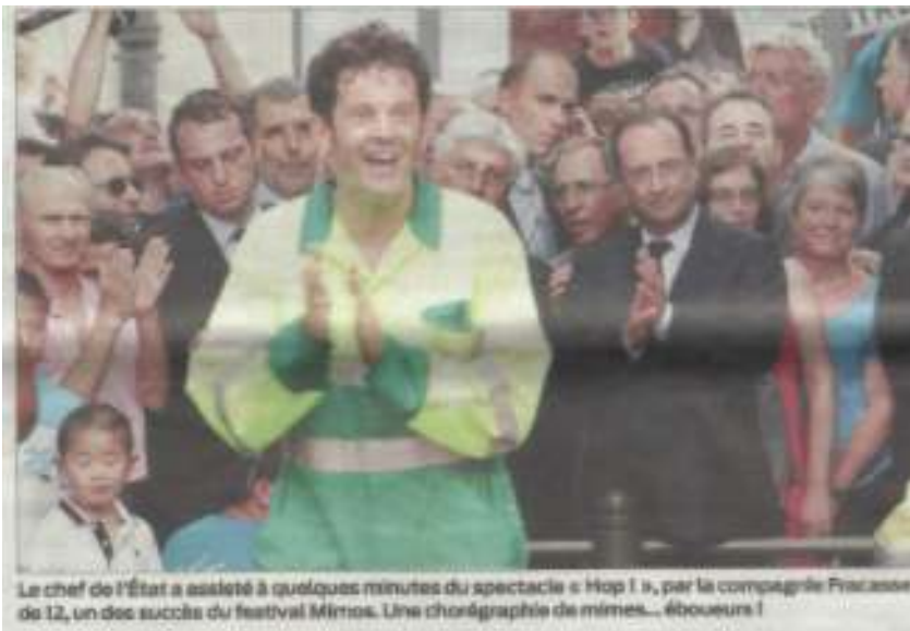
Le chef de l'état a assisté à quelques minutes du spectacle « Hop I », par la compagnie Fracasse de 12, un des succès du festival Mimos. Une chorégraphie de mimes... éboueurs !

Festival Mimos à Périgueux ; juillet 2013. Les jeudis de l'été à St Avé ; Août 2013